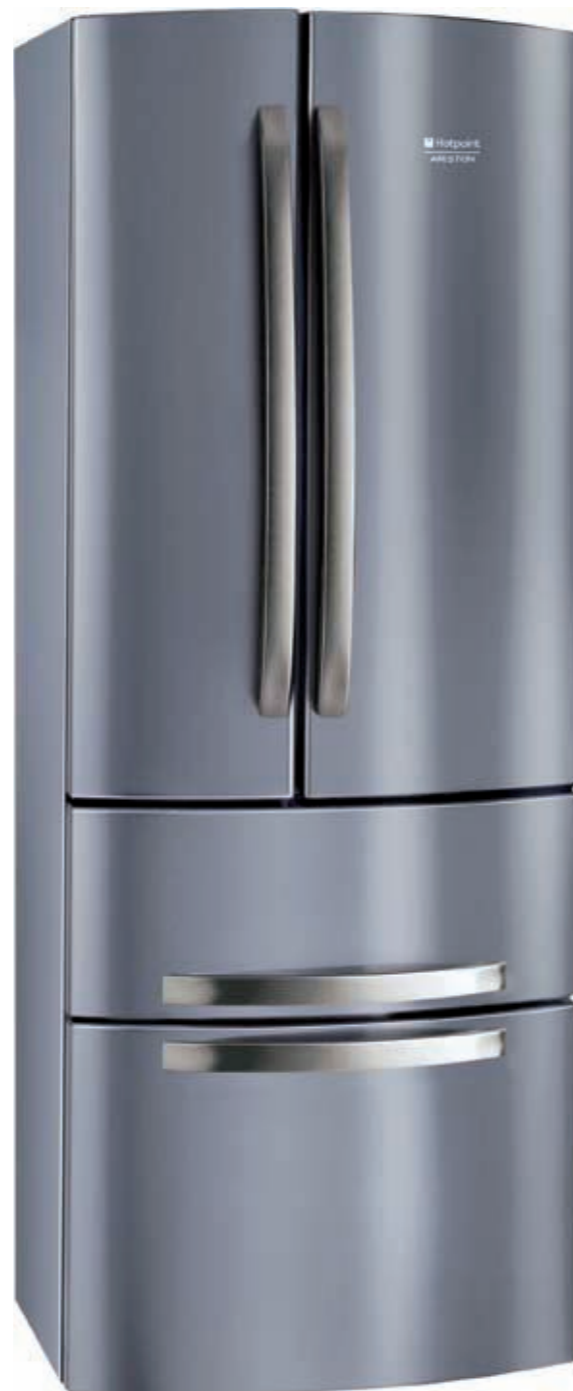
Modello: 4 D X HA