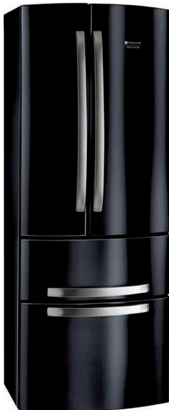
Modello: 4 D B HA